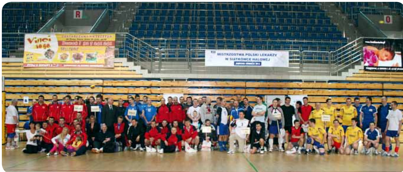
Uczestnicy XII Mistrzostw Polski Lekarzy w Siatkówce Halowej, 16-18.03.2012 r., Dąbrowa Górnicza.